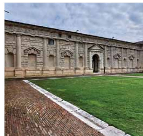
CORTILE D'ONORE E SALA DEI CAVALLI PALAZZO TE MANTOVA