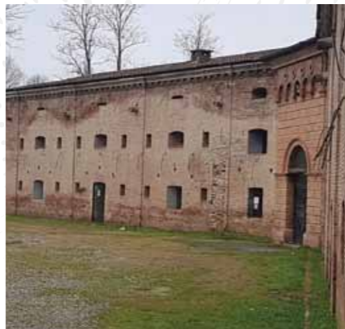
FORTE DI BORGOFORTE