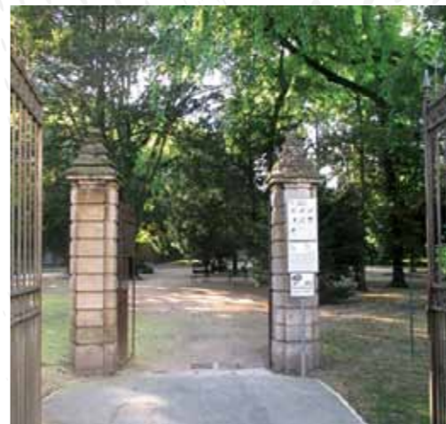
GIARDINI VALENTINI MANTOVA