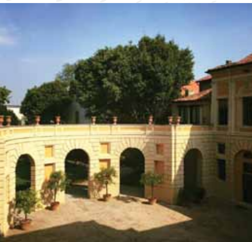
CORTILE DI PALAZZO D'ARCO MANTOVA