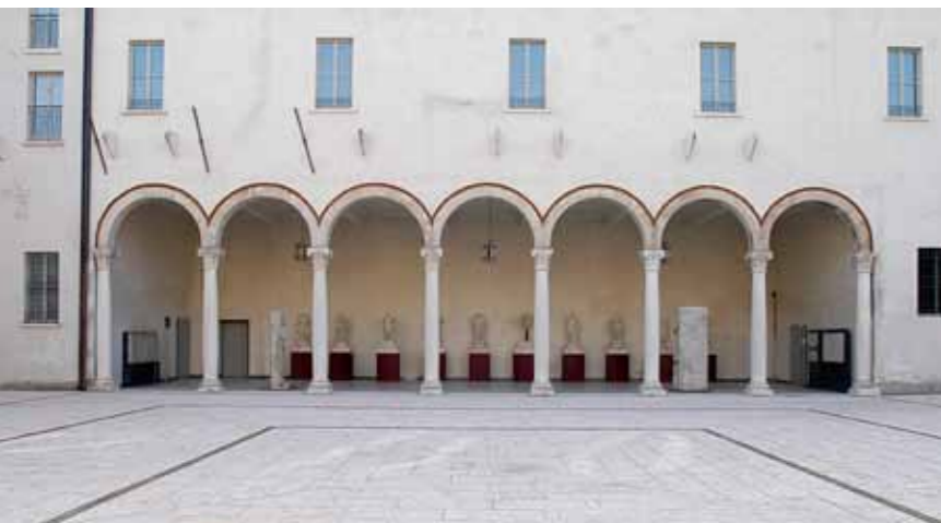
LOGGIATO DI SAN SEBASTIANO MANTOVA