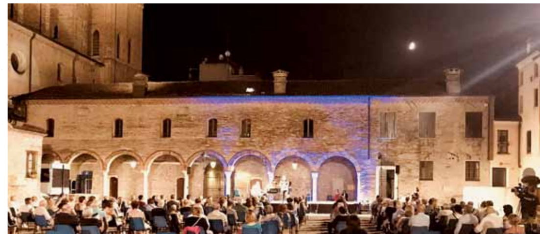
PIAZZA LEON BATTISTA ALBERTI MANTOVA