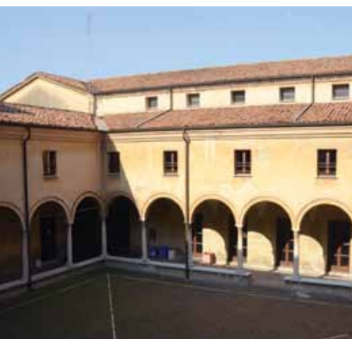
SALA ISABELLA D'ESTE ISTITUTO D'ESTE MANTOVA